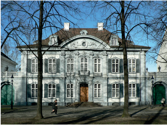
Abb. 8. Basel, Haus Burckhardt-Wildt am Petersplatz, Johann Jacob Fechter, 1762–1764, http://de.wikipedia.org/wiki/Datei:Wildtsches_Haus.JPG (abgerufen am 20. September 2022) / Public Domain Mark.

einer fehlenden Zentralmacht griff die Barockwelle jedoch nicht in den Städtebau über: Basel kennt daher keine barocken Prachtstrassen und Avenuen, sondern die Palais mit ihren Gartenanlagen bleiben stets dem mittelalterlichen Stadtgepräge verhaftet.