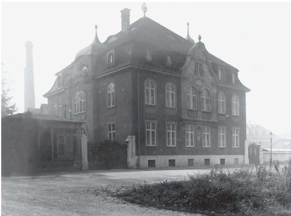
Abb. 2. Basel, Bau 1, die sog. Villa Blume, Verwaltungsbau des F. Hoffmann-La Roche & Co. Pharmaunternehmens, Romang & Bernoulli, 1904/1905