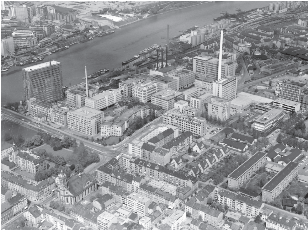
Abb. 7. Basel, Ciba-Geigy, Blick nach Nordwesten mit überformtem Verwaltungsgebäude durch das Architekturbüro Suter & Suter, Fotograf: Werner Friedli, 1965. © ETH-Bibliothek Zürich, Bildarchiv / Stiftung Luftbild Schweiz / LBS_ H1-025944 / CC BY-SA 4.0 / Public Domain Mark.

Durch die steten Aus- und Umbauten des Verwaltungsgebäudes ab 1915 – zunächst unter Fritz Stehlin selbst, später unter seinem Neffen Hans Eduard Ryhiner (1891–1934) und ab den 1950ern durch das Architekturbüro Suter & Suter (gegr. 1901) – wurde der Schlosscharakter des Verwaltungsbaus zusehends gestärkt. Die barocke Formgebung mit ihren gliedernden Elementen erlaubt dies problemlos. Gleichzeitig wurde der sich leicht S-förmig entwickelnde Baukubus stilistisch immer weiter purifiziert (Abb. 7).