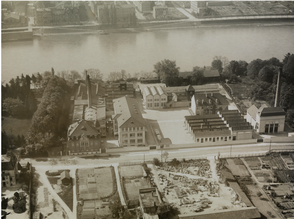
Abb. 1. Basel, F. Hoffmann-La Roche & Co. Pharmaunternehmen , 1918–1932.