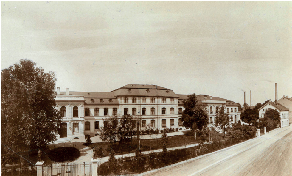
Abb. 6. Basel, Ansicht des erweiterten Verwaltungsgebäudes der Gesellschaft für Chemische Industrie Basel von der Klybeckstrasse, Fritz Stehlin, 1915–1931.

darunter das beschriebene Verwaltungsgebäude. 12 Die im französischen Barock-Klassizismus gehaltenen Fassaden mit vorspringenden Risaliten liessen sich sehr gut beliebig erweitern und spiegelten die soziale und ökonomisch wichtige Stellung der Chemischen Industrie für die Stadt und die Region wider. Bereits 1915 zeichnete Stehlin selbst für die erste Erweiterung des Baus verantwortlich, der in der Folge immer weiter ausgebaut und überformt werden sollte (Abb. 6).