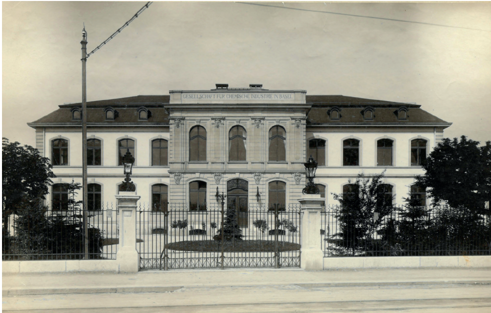
Abb. 4. Basel, Verwaltungsgebäude der Gesellschaft für Chemische Industrie Basel, Fritz Stehlin, 1905–1915.