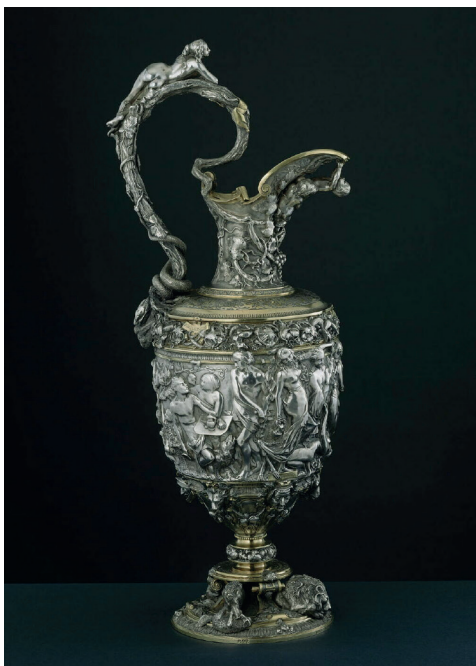
Fig. 1. Charles Wagner, Aiguière de la Tempérance et de l'Intempérance , 1837–1839, argent doré et repoussé, 62.8 x 25.5 cm, Paris, Louvre, n° inv. OA12119.