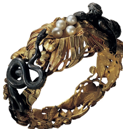
Fig. 2. François-Désiré Froment-Meurice, Collier , après 1851, argent, or et verre, 6 cm (pendant), Londres, British Museum, n° inv. 1978,1002.725 © The Trustees of the British Museum.

à partir de 1839. Ce dernier, orfèvre-bijoutier-joaillier, célèbre représentant du style en France,