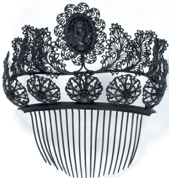
Fig. 6. Peigne, vers 1820, fonte de fer, 15.5 x 14.5 x 8.5 cm, Londres, Victoria & Albert Museum, n° inv. 546-1899, © Victoria & Albert Museum, London.

rachète en 1842 et 1843 les brevets déposés par le manufacturier George Elkington (1801–1865) et le chimiste Henri de Ruolz (1808–1883). 22 Sur le même principe, Oscar Massin (1829–1913), joaillier de grande qualité, réussit à transposer des modèles de guipures en broderie vénitienne datant du 16 e siècle à une version en platine sertie de diamants. Cette technique de dentelles de diamants (Fig. 7), pour laquelle il dépose un brevet d'invention en 1878 23 , lui garantit un Grand Prix à l'Exposition universelle de la même année. D'autre part, le développement des machines-outils au sein des ateliers, répondant à une logique de production industrielle, a permis la commercialisation en série de bijoux réalisés par estampage. Cette technique ancienne consiste à presser machinalement une fine feuille de métal entre deux matrices mâle et femelle afin d'y imprimer un motif répété à volonté. Ce procédé engage peu de matière et limite l'intervention de l'homme dans un processus semi-industriel.