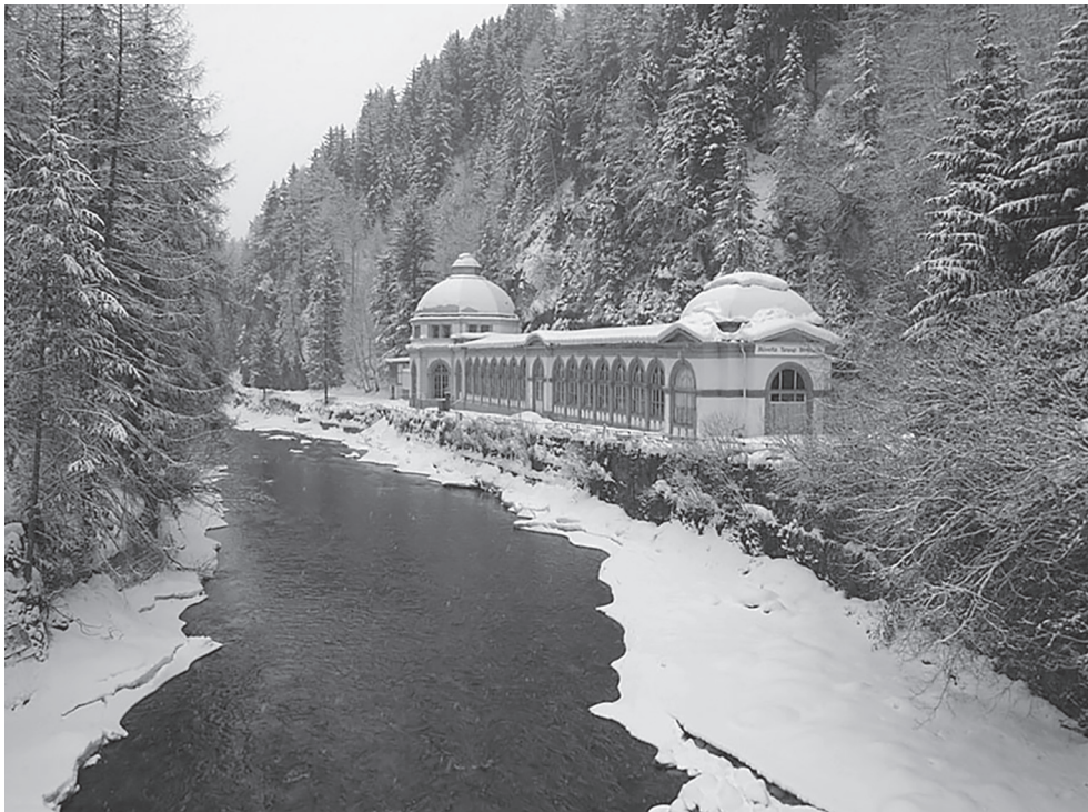
Abb. 3. Scuol, Büvetta Kurhaus Tarasp.

Zurück im 19. Jahrhundert sind es tatsächlich, neben vielleicht den unerwähnt gebliebenen staatlichen Repräsentationsbauten, vorwiegend Hotelbauten und den Hotels zugewandte Bauten, welche als Hauptvertreter des Historismus im Kanton Graubünden zu identifizieren sind. Von St. Moritz aus gesehen innabwärts findet man einen weiteren hochwertigen Vertreter dieser Gattung. Die Büvetta oder eben Trinkhalle des ehemaligen «Bad Tarasp». Von 1875–1876 lieferte hier der profilierte Bad- und Kurhotelarchitekt Bernhard Simon (1816–1900) ein Meisterstück ab (Abb. 3), welches noch heute höchste Würdigung erfährt. 6 Insbesondere den Architekten Simon würdigt Ludmila Seifert in ihrem monographischen Aufsatz zur Büvetta wie folgt: