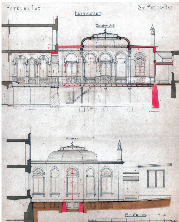
Abb.4. St. Moritz, Hotel Du Lac, Pläne ohne Datum von Nicolaus Hartmann sen.

Mit Blick auf die Hotelbauten selbst muss man kritisch feststellen, dass bereits sehr viel, auch historistische Substanz, verloren gegangen ist. Nicht nur, dass auf Grund der verändernden Kundenwünsche viele Innenausstattungen weichen mussten, auch sind ganze Hotelanlagen aus ökonomischen Gründen ersatzlos verschwunden. So zum Beispiel das Hotel du Lac in St. Moritz, welches mit seinem Restaurant im Maurischen Stil (ausgestattet 1898) ein wunderbares Beispiel des Historismus abgeben hätte. Bereits an dem von Nicolaus Hartmann sen. (1838–1903) entworfenen Restaurantanbau war die Innenausstattung abzulesen (Abb.4). Das Du Lac wurde in einer regelrechten Boomzeit 1875 errichtet, bis um 1900 weiterentwickelt und 1974 wieder abgebrochen.