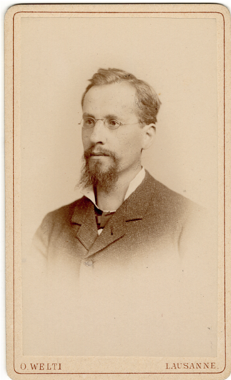
Fig. 1. Portrait de Benjamin Recordon en 1886, photo Oswald Welty, Lausanne (ACM, 23.4.1/47).

seur d'Ernst Gladbach à la chaire de construction de l'École d'architecture du Poly. Le nouveau professeur, premier Welsche à donner en français un cours obligatoire, conserve néanmoins une activité pratique, construisant le nouveau bâtiment du laboratoire des machines de l'École polytechnique (1897–1899) et le temple français de Zurich (1900–1902).