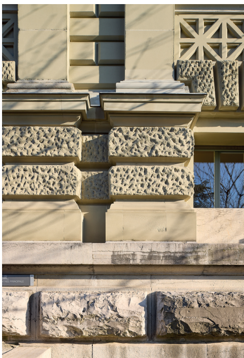
Fig. 5. Lausanne, Palais de justice de Montbenon, vestibule.