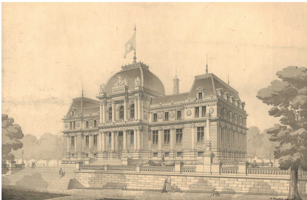
Fig. 2. Lausanne, Palais de justice fédéral de Montbenon, architecte Benjamin Recordon, 1881–1886, vue perspective de 1883.

Conscient de l'importance de son œuvre, Recordon a conservé un journal tenu pendant le projet. 8 On y découvre un architecte suivant étroitement le chantier, en relation directe avec les maîtres d'état et les fournisseurs, en particulier l'entrepreneur Charles Pache fils (1858–1910) 9 , responsable des fondations, de la maçonnerie et de la taille des pierres. L'architecte surveille ainsi la qualité parfois douteuse du béton et du mortier, prend part à des décisions techniques ou réclame l'intervention d'un ouvrier spécialisé pour la taille des bossages, autant d'interventions qui témoignent de sa bonne connaissance des matériaux et de leur traitement. En 1881 et 1882, Recordon effectue également un important travail préparatoire de visite de carrières (fig. 3). Il s'intéresse en premier lieu aux gisements vaudois, notamment dans le Chablais, près d'Orbe et d'Oron, mais pousse aussi hors des limites du canton, avec des excursions à Genève, Lucerne ou Berne; enfin, à l'occasion d'un voyage d'études qui le mène à Bâle, Strasbourg et Belfort, l'architecte se rend aux carrières de Belvoeye près de Dole, qui lui livreront des matériaux pour le tribunal.